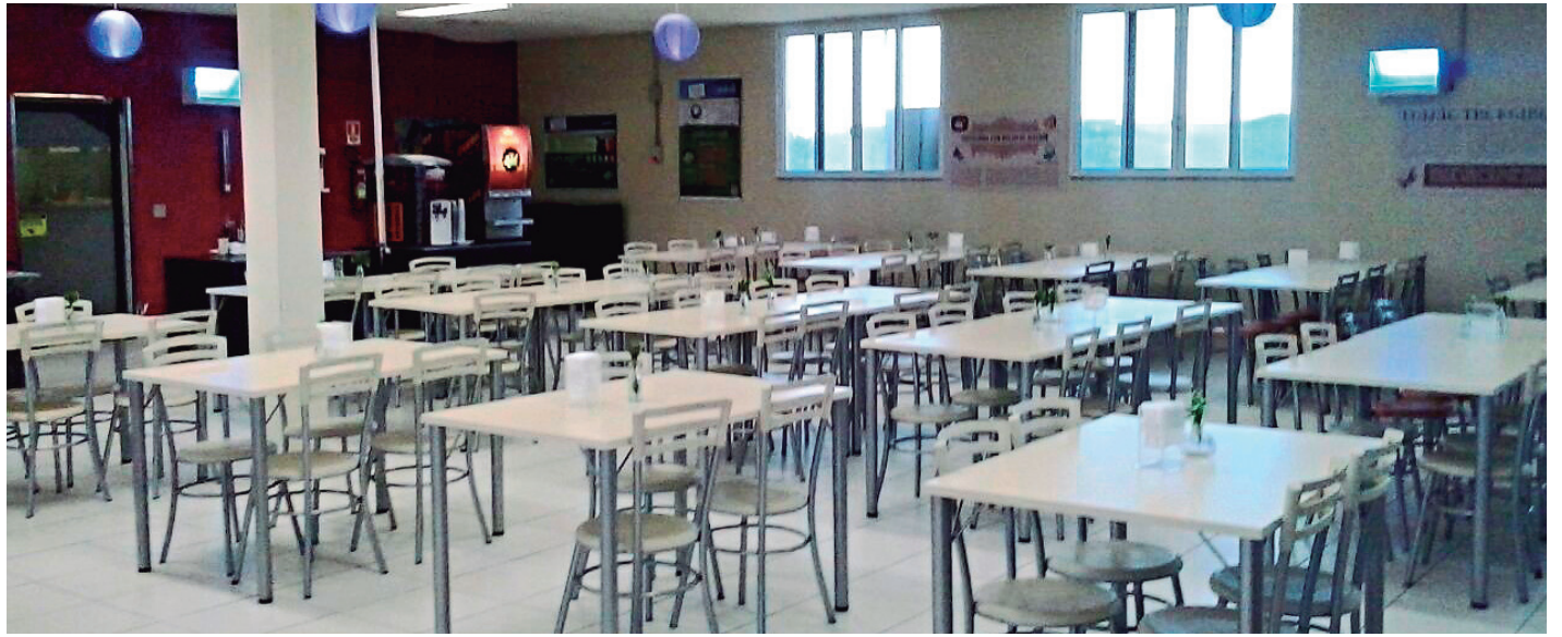
Restaurante dos funcionários da Bosch (Louveira), que os trabalhadores que fazem a vigilância da empresa também podem utilizar

Antes, o trabalhador da GPS era obrigado a levar comida de casa. Além disso, o Sindicato apurou que a sala onde eram feitas as refeições não tinha