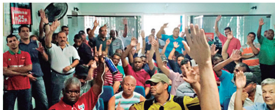
Vigilantes aprovam reivindicações, por unanimidade, em assembleia dia 19 de outubro

Até lá, negociaremos com a classe patronal uma ampla pauta de reivindicações. Nossa luta é por reajuste decente nos salá-